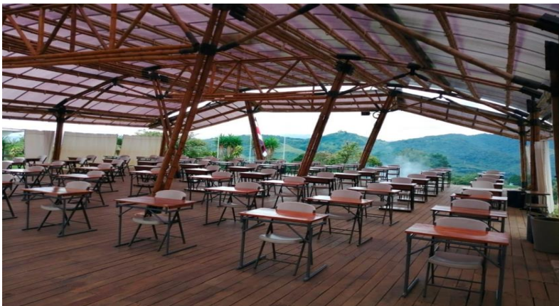
Imagen 1. Distribución de escritorios en Salón principal Bambú

El lugar es abierto para resguardar la seguridad de las personas y se tendrán toldos a los lados en caso de lluvia.